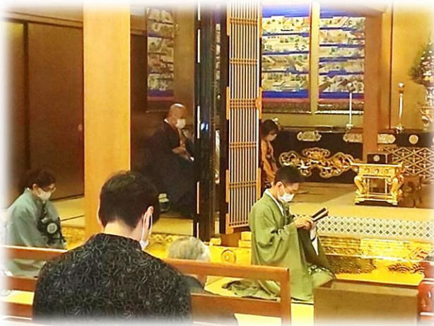
鹿児島別院伊敷支院報恩講 御俗姓拝読