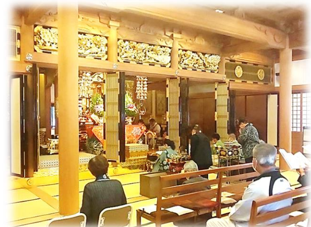
鹿児島別院伊敷支院 速夜