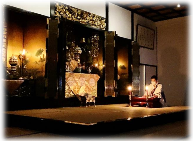
長崎教会報恩講 御伝鈔拝読