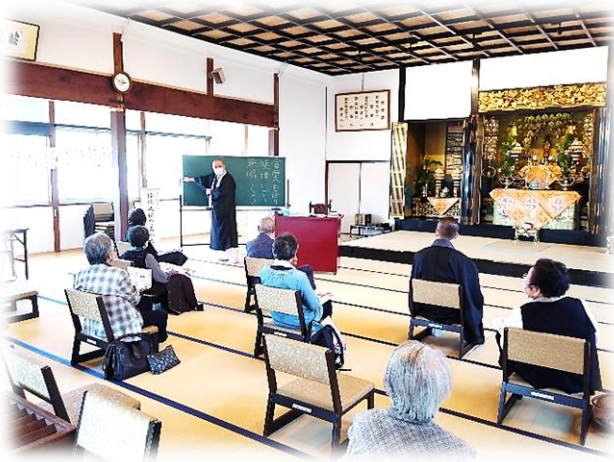
長崎教会報恩講 御法話